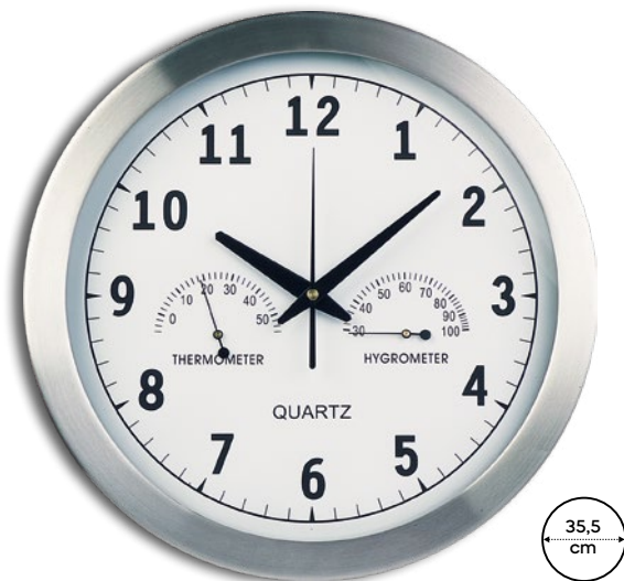
Cloky E14401 € 21,70