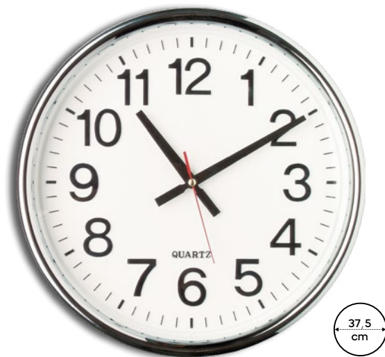
Tema E14409 € 25,88