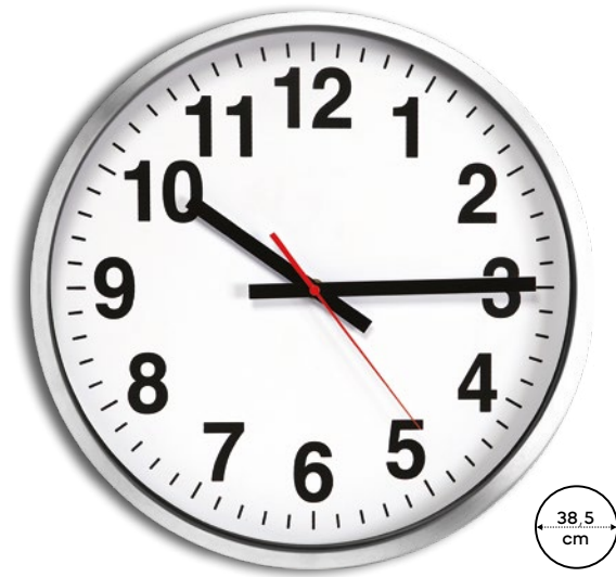
Ora E14408 € 26,01